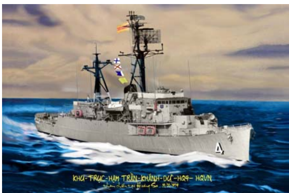
Khu Trục Hạm Trần Khánh Dư HQ4 tham chiến trận hải chiến Hoàng Sa